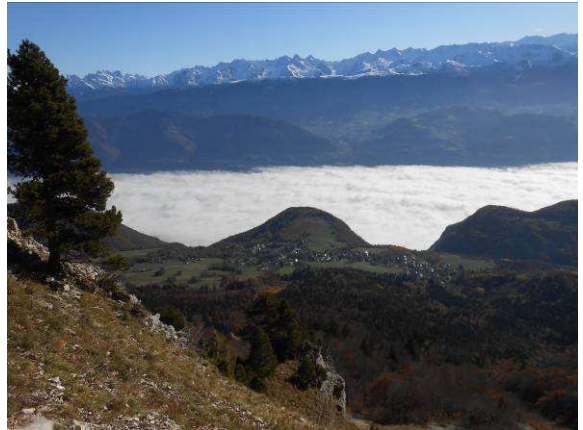
Vue sur la vallée