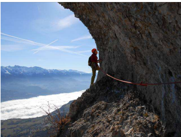
Départ de L3