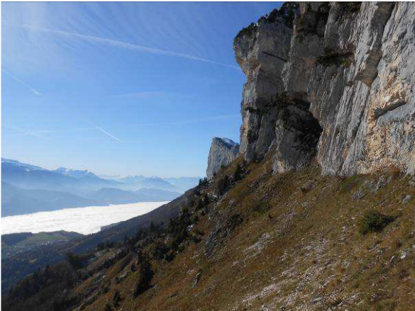
Accès depuis le chemin du pas de Montbrun