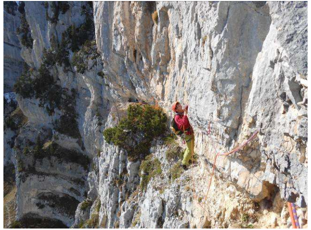
Départ de L5 après la traversée